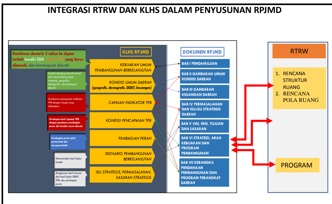
Gambar 1.2 Integrasi RTRW dan KLHS Dalam Penyusunan RPJMD

Berdasarkan Kajian Lingkungan Hidup Strategis, Provinsi Kalimantan Timur ke depan dibangun dengan kerangka konsep pembangunan berkelanjutan melalui pendekatan ekonomi hijau dalam implementasinya. Tujuan dan Sasaran pembangunan Provinsi Kalimantan Timur selama lima tahun kedepan diarahkan untuk mencapai sejumlah target pencapaian tujuan pembangunan berkelanjutan ( Sustainable Development Goals , SDGs) yang terdiri dari empat pilar yaitu; mulai dari aspek kemiskinan, kesehatan, pendidikan dan gender (Pilar Sosial); energi terbarukan, pertumbuhan ekonomi, dan keadilan-pemerataan kesempatan akses, distribusi produksi-konsumsi komoditi (Pilar Ekonomi); isu terkait lingkungan hidup dan perubahan iklim (Pilar Lingkungan Hidup); dan langkah-langkah reformasi birokrasi dan ASN dalam meningkatkan tata-kelola pemerintahan (Pilar Hukum dan Tata Kelola).